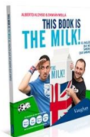
This Book is the Milk! Principiante, Intermedio, Avanzado