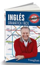
Gramática fácil Principiante, Intermedio